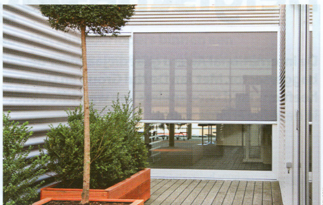
FIXSCREEN VAN RENSON De jeugdige strakheid van het fijne zonnescrm is onmiskenbaar een architecturale troef.

Als tweede laureaat hebben we gekozen voor de zonnepanelen van Sunswitch . Ze worden gekenmerkt door een hoog rendement en een minstens even hoge graad van elegantie. Ze strekken zich glad uit over het volledige dakoppervlak en weerspiegelen de lucht zwart zonder dat het traditionele blauwe raster stoort. Deze nieuwe generatie van fotovoltaïsche cellen op