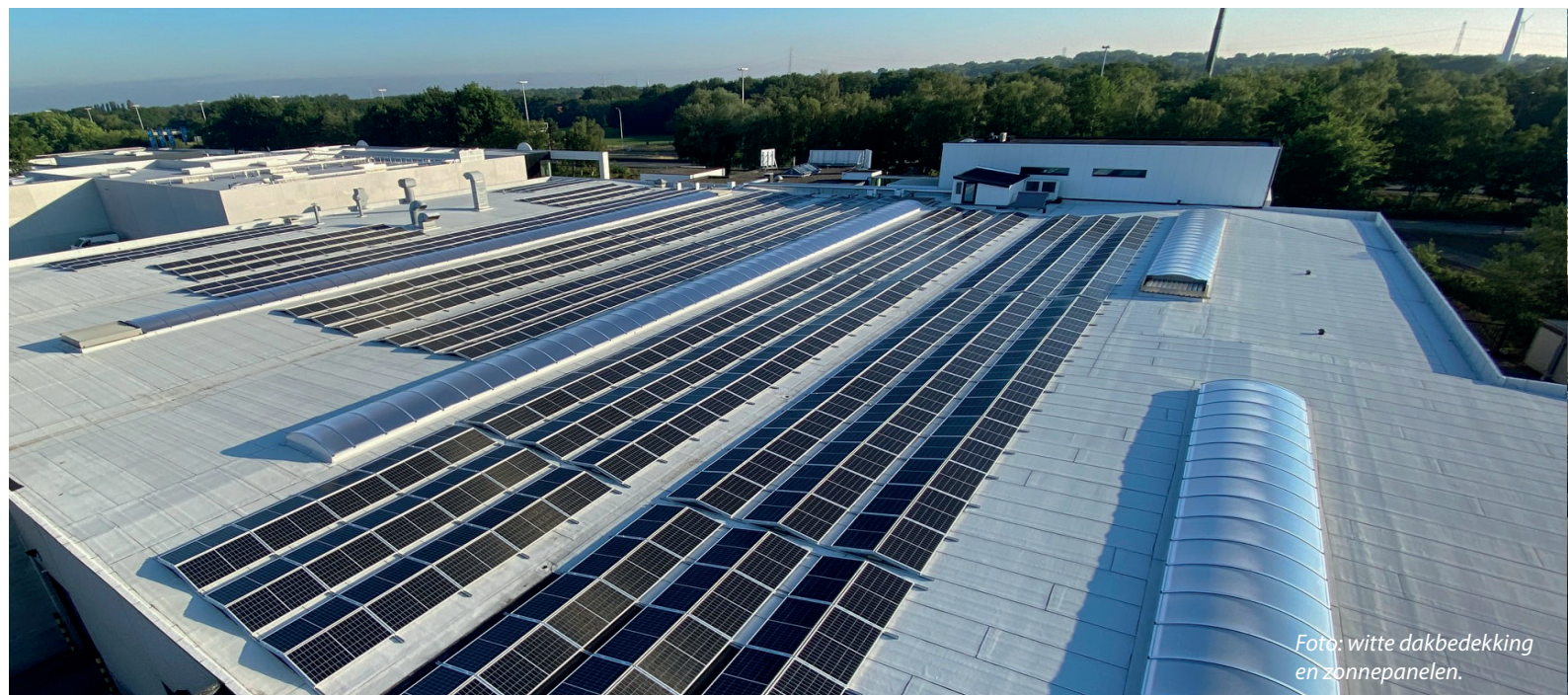
Foto: witte dakbedekking en zonnepanelen.

"We zetten sterk in op het opzetten van energie- en grondstoffenefficiënte processen. Dit is een win-win, zowel voor de klant, het bedrijf als voor het milieu."